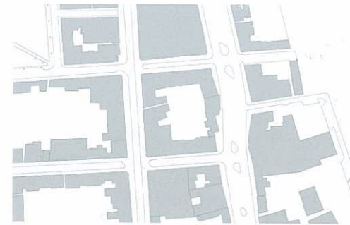
Situatie oud: pakhuis