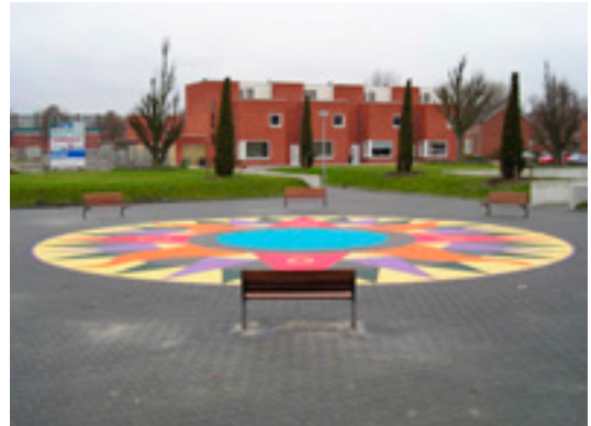
WAL architecten, Radiumstrook, Vinkhuizen, Groningen. De stedenbouwkundige stempel van de nieuwbouw is licht gedraaid ten opzichte van de bestaande stedenbouw

Kleinere, vaak meer subtiele gebaren zitten vooral op het niveau van de stempel, of in sommige gevallen zelfs op dat van de strook. Zo zijn in de buurten ten zuiden van