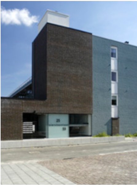
De Zwarte Hond, nieuwe hoofdentree voor opgedeel- de voormalige portiek- etageflat Siersteenlaan, Vinkhuizen, Groningen, 1998-2003