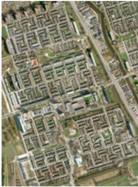
Vinkhuizen, Groningen, 2009