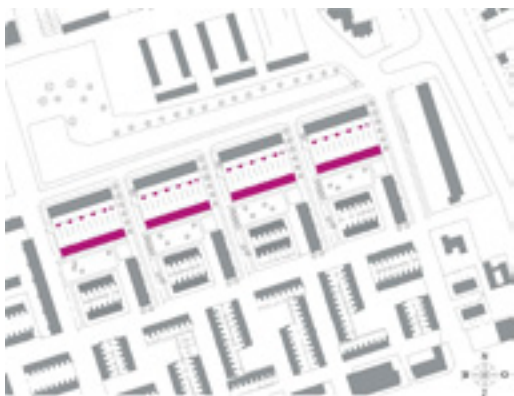
Zofa architecten, situatie 'Zirkoon'. De 44 woningen zijn verdeeld over vier rijen van elf woningen, die door middel van een doorgetrokken tuin- en terrein-afschieding verbonden zijn met de portiekflats aan de Kornalijnlaan