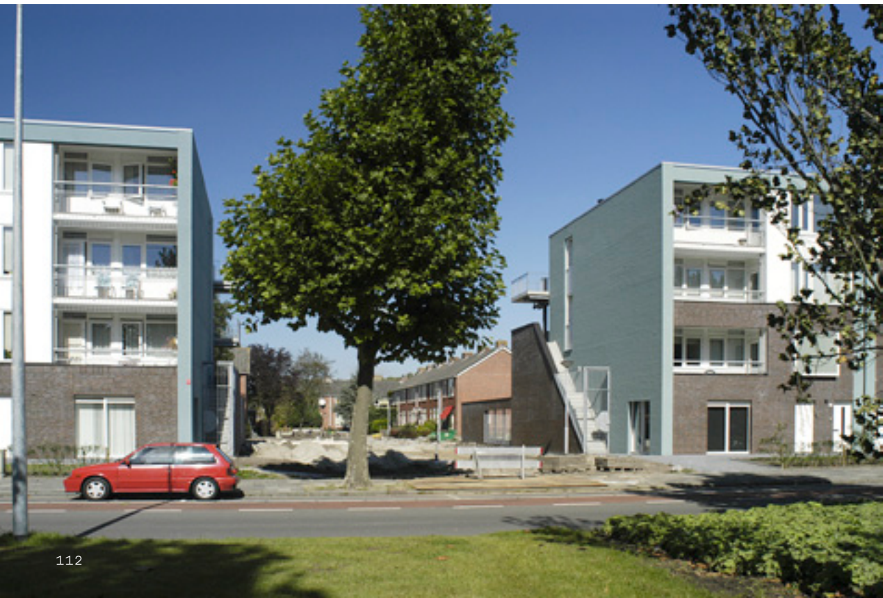
De Zwarte Hond, her- structurering Siersteenlaan, Vinkhuizen, Groningen, 1998-2003