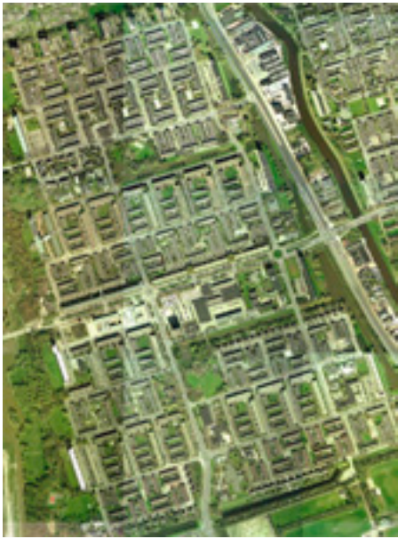
Vinkhuizen, Groningen, 2000