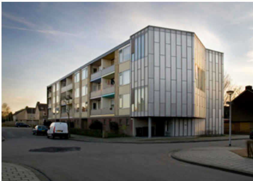
Onix, woningbouwproject 'De Spouw', Arduinlaan, Vinkhuizen, Groningen

Gesprek met Sjoukje Veenema (Lefier), wijkontwikkelaar Vinkhuizen t.f.v. de wijkvernieuwing