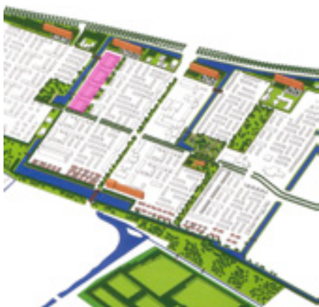
Zofa architecten, ruimtelijk raamwerk 'Zirkoon', Vinkhuizen, Groningen