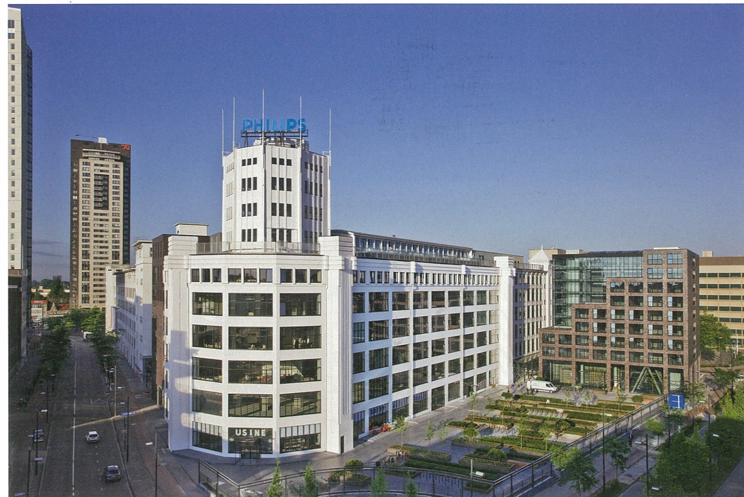
1 en 2 awg architecten is verantwoordelijk voor het ontwerp van de herbestemming van de Lichttoren in Eindhoven. De oude Philipsfabriek is zoveel mogelijk in zijn waarde gelaten en tegelijkertijd heeft een nieuw programma zich gevoegd naar de oude structuur.

Het vertrekpunt voor de aanpak van Complex 40 in de Amsterdamse wijk Overtoomse Veld uit 1954 lag niet in het behoud van de originele architectuur, maar in het verhogen van de woonkwaliteit. KAW Architecten moest de bestaande