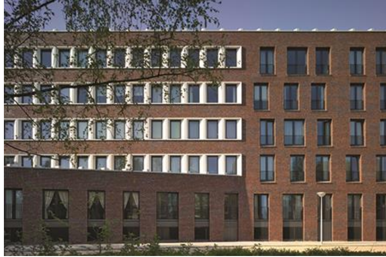
Appartementen Jean Sibelius, Eindhoven