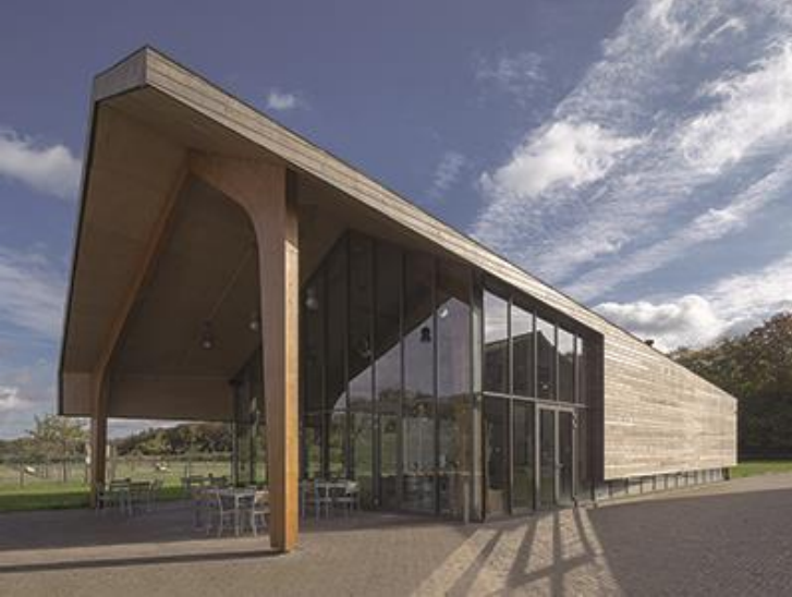
Stadspoort Landbouw, Eindhoven