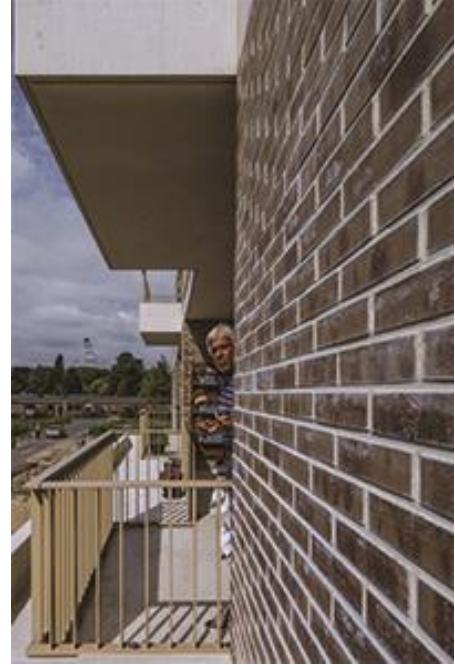
Seniorenwoningen in de Wielewaal, Rotterdam