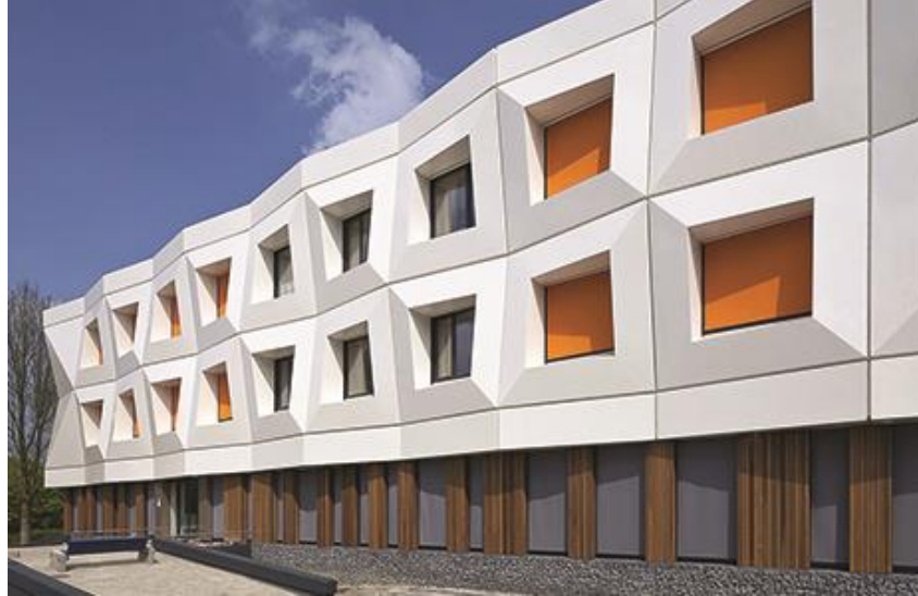
Veilige Veste, Leeuwarden