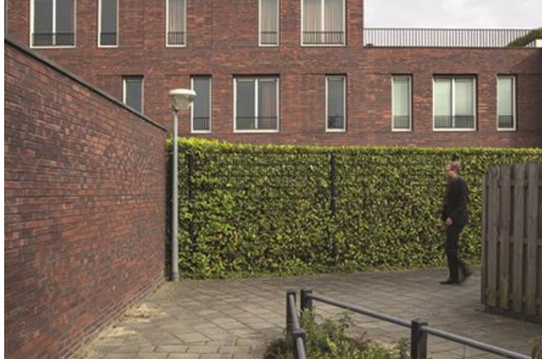
Zorgcomplex De Jol, Lelystad