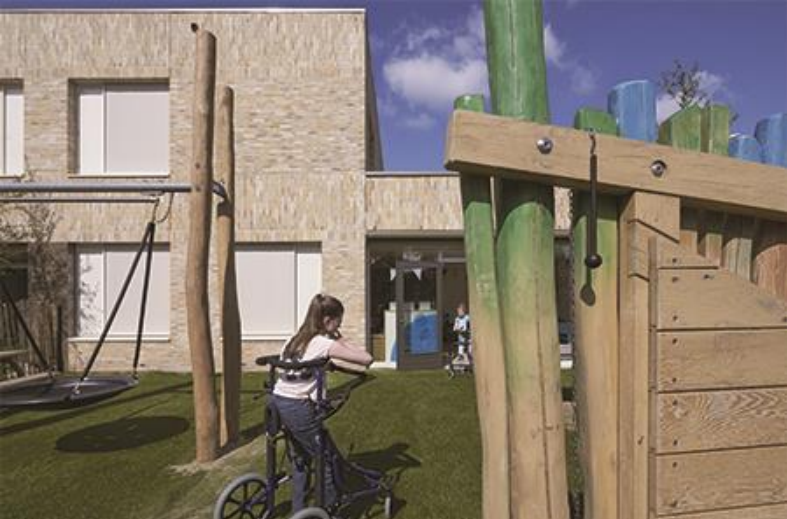
Kinderdagcentrum De Boemerang, Hilversum